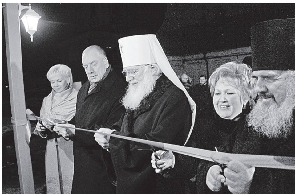
Красная ленточка разрезана!