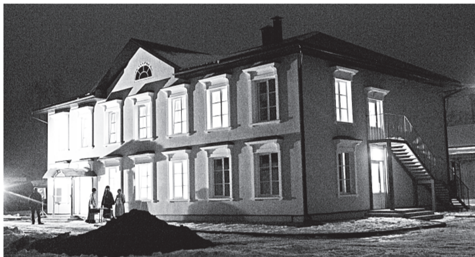
В Духовно-просветительском центре ждут боровичан