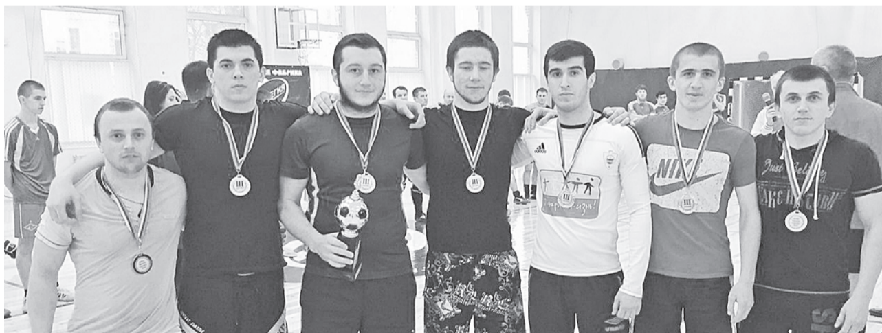
«Когда мы едины, мы — непобедимы!»

няли участие шесть команд: ветеранский состав Боровичей, два состава