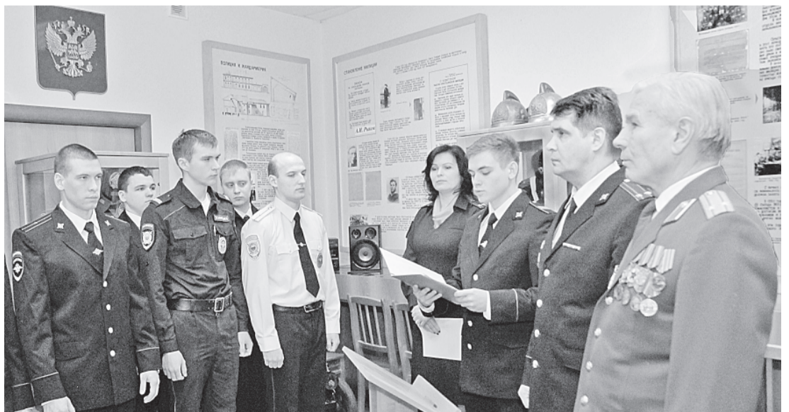
«Обязуюсь уважать и защищать...»