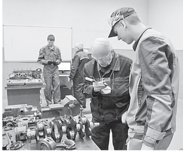
WorldSkills в автодорожном колледже

В рамках чемпионата прошли лекции, «круглые столы», семинары с участием представителей региональной и муниципальной власти, врачей и пе-